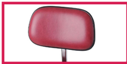
ACC 10 Dossier pour gamme PRISCA, 120, 30 et 40