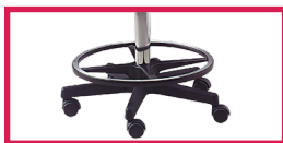
ACC 15 Repose pieds