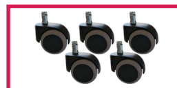
ACC 964 Jeu de repose jambes noir, sur rotule mousse polyuréthane, diam. 14mm, sans étai