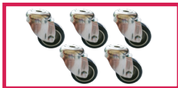
ACCROULETTE-02 5 roulettes simple galet diam. 50mm