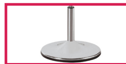
ACC 16 Pied sur socle chromé diam. 38cm (Enlève 1cm à la hauteur)