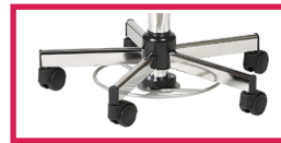
ACC 14 Commande au pied