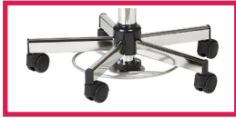
ACC 14 Commande au pied