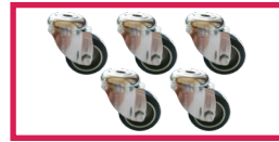
ACCROULETTE-02 5 roulettes simple galet diam. 50mm