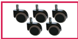
ACCROULETTE-05 5 roulettes auto-freinées en charge ou hors-charge