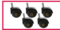
ACCROULETTE-04 5 roulettes antistatiques diam. 50mm