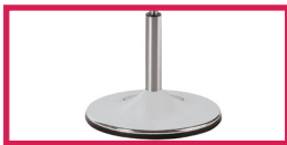
ACC 16 Pied sur socle chromé diam. 38cm (Enlève 1cm à la hauteur)