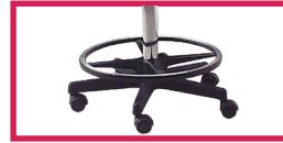
ACC 15 Repose pieds