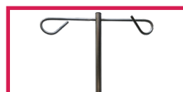
ACC 32014 Tige porte-sérum inox diam. 16mm, 2 crochets inox, sans étau