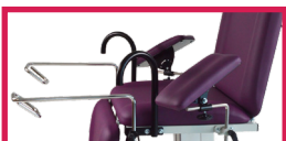
ACC 113U-105 Jeu de poignées de maintien latérales, avec étaux pour adapter une paire d'étriers prêt à fixer sur fauteuil