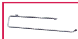
ACC 125 Porte rouleau adaptable tous modèles