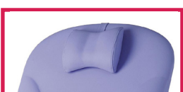
ACC TETERGO Tête ergonomique amovible