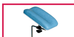
ACC 110 Gouttière prise de sang Avec ferrure, sans étau, l'unité