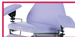
ACC 514-ASSISE Protection plastique assise