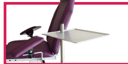
ACC 910-PLAT02 Plateau inox support 340x340 avec étau