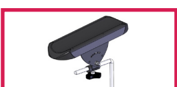
ACC 110POLY Gouttière prise de sang polyuréthane avec ferrure Sans étau, l'unité