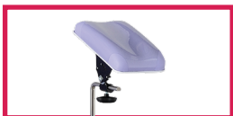
ACC 514-GOUT Protection gouttière en plastique transparent, l'unité