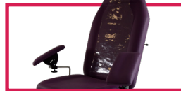
ACC 517-512 Protection plastique pour dossier