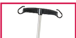
ACC 32012 Tige porte-sérum inox diam. 16mm, 2 crochets plastiques, sans étau