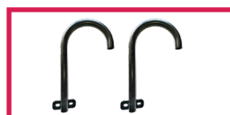
ACC 113U Jeu de poignées de maintien latérales, sans étau prêt à fixer sur fauteuil