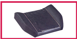
ACC 514-JAMBIÈRE Protection plastique pour jambière