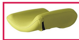
SLFEMIREPOSE Housse prélude pour repose jambes (ACC964), l'unité