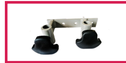
ACC 535 Jeu d'étaux double diam. 14mm et 16mm pour gouttière + tige porte-sérum