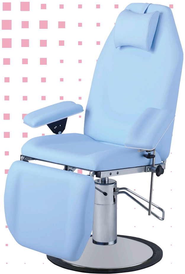
Photo non contractuelle - modèle sans jambièr