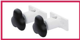
ACC 537 Jeu d'étaux diam. 14mm pour gouttières et étriers pour toutes gammes sauf LUVIA