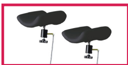
ACC 964 Jeu de repose jambes noir, sur rotule mousse polyuréthane, diam. 14mm, sans étau