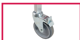
ACC 990 Jeu de 4 roulettes à frein diam. 125mm